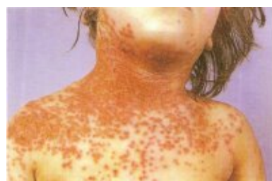
Ekzema herpeticatum. Typische Komplikationen bei Neurodermitis